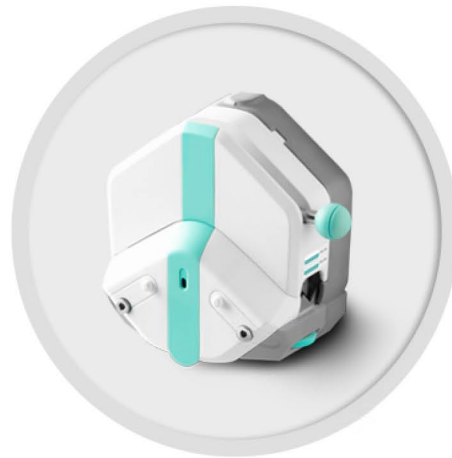
EasyPump 系列 (不可调压)