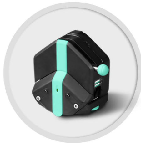
EasyPump-PPS 系列 (不可调压)